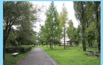
広い湖岸緑地の周囲がポイント。湖岸緑地内の遊歩道を利用して釣り場へ出られる