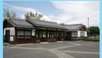
駐車場の横には立派な休憩所やトイレがあり非常に便利。ファミリーフィッシングにも最適だ