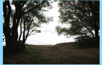
遊歩道から湖岸へ楽にアクセスできるが非常に遠浅なのでウェーダーがほしい