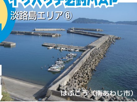
はぶこつ (南あわじ市)

■太平洋に連なる紀伊水道に面した土生港は淡路島のなかでも特異な存在。釣れる魚種、そのサイズが和歌山や徳島に近いのだ。青物にマダイ、グレ、チヌなど良型、大型が期待できる。当然波は荒く防波堤外側に積まれたテトラは巨大。誤って落ち込むと自力で這い上がることはまず不可能。釣りはテトラを敬遠しケーソン上からに限りてほしい。そうするとポイントは限られるが港内向きでも面白い釣りが期待できる。渡船利用で一文字に渡るのもいいだろう。