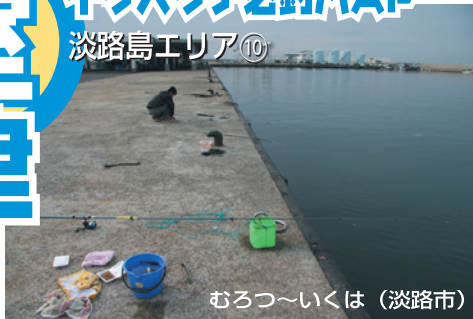
むろつ〜いくは (淡路市)