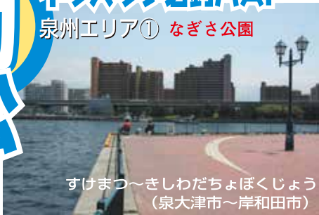
すけまつ〜きしわだちよぼくじょう (泉大津市〜岸和田市)

■以前は釣りができる場所が多かった助松ふ頭、汐見ふ頭だが、テロ対策の改正SOLAS条約で立入制限が厳しくなり、また暴走族対策で夜間の進入が禁止(助松で21時〜5時、汐見で20時〜5時。出るのはOK)され、釣り人には不自由になったが、それでも車横付けで竿が出せるポイントも残っているので、サビキ釣りやタチウオ釣りファンには人気が高い。エビ撒きでハネやチヌをマニアクに狙う向きには、岸和田貯木場がおすすめだ。