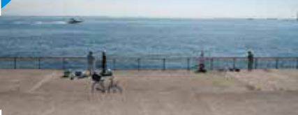
みなみあしやはま (芦屋市)

■ヨットハーバー (ベルポート芦屋) と潮芦屋ビーチ以外の、周囲どこからでも竿を出せる大きな埋立地で、北岸の水道部、西岸が石畳、南岸と東岸の一部が手すり付きベランダで、足場もよく安全。駐車場、トイレも多いのでファミリーフィッシングに最適な場所。釣りものも豊富で、ポイントさえ間違わなければサビキ釣りから探り、ブツ込み、エビ撒き釣り、落とし込み釣り、ルアーとあらゆるジャンル釣りが楽しめる。浅い石畳では竿下のサビキ釣りが難しい。