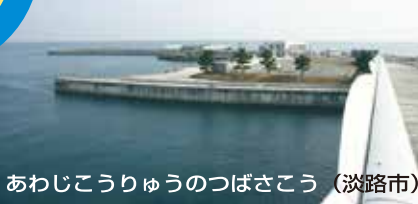
あわじこうりゅうのつばさこう (淡路市)