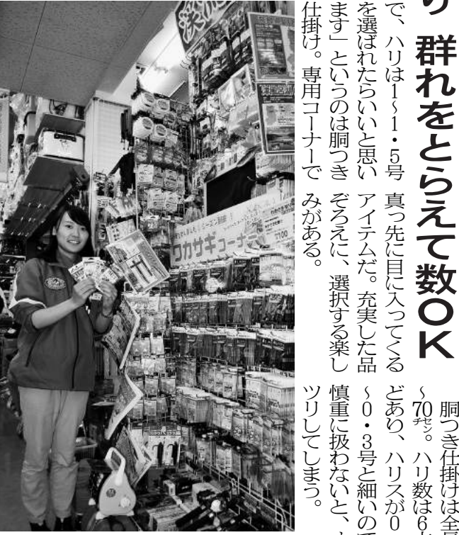
家族みんなで楽しめるワカサギ

「エサのサシ虫をハリに刺してから、ハサミで切って体液を出すと食いがよくなるんです」といって、仲間と協力している。サオを2本以上出した