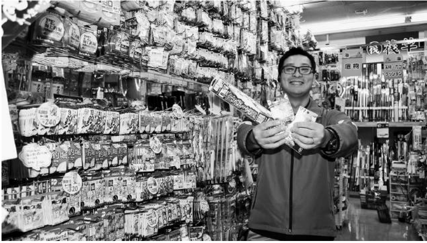
海上釣り堀でお正月用の大物ゲット。専用コーナーでひとそろえ

ポイントカードご入会(新規)で、3000円以上お買い上げの方に、もれなく大手メーカーのお好きなフィッシングカレンダーをプレゼント