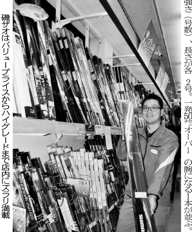
磯サオはバリュープライスからハイグレードまで店内にズバリ満載

「エサのサシ虫をハリに刺してから、ハサミで切って体液を出すと食いがよくなるんです」といって、仲間と協力している。サオを2本以上出した