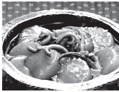
イカと大根の煮物